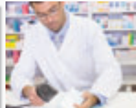
Les marchés hospitaliers