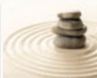
Pratiques psycho- corporelles